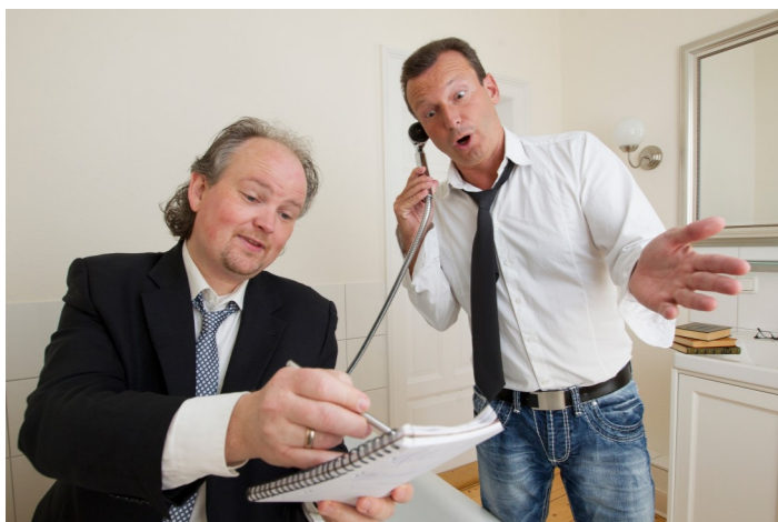
Foto: Stephan Winkelhake und Frank Suchland gastieren am 23. April mit „Heiter weiter ...“ im Domschatz Minden.

Tickets sind im Besucherservice des Domschatzes und online auf www.dvm-event.de erhältlich.