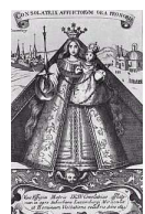
Gnadensbild in Kevelaer

Der Fahrpreis richtet sich nach dem Angebot des Busunternehmens und der Anzahl der Pilger (Vorjahr 27 €).