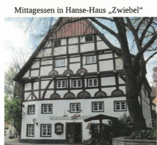
Mittagessen in Hanse-Haus „Zwiebel“