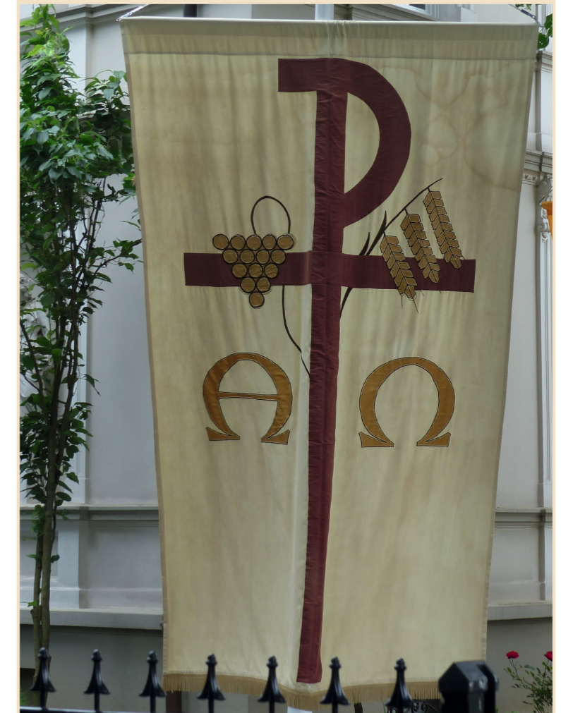
Erik Varden OCSO

Redaktionsschluss für Beiträge und Informationen, die in den Pfarnachrichten veröffentlicht werden sollen, ist jeweils sonntags vor dem Erscheinungsdatum.