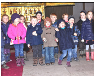
Die Kinder des Minichores hatten viel Spaß bei ihrem Auftritt