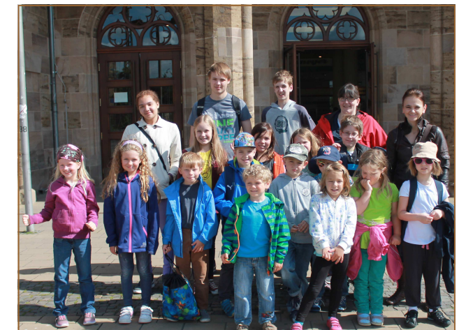
Die Fotos stehen online unter www.djk-dom-minden.de